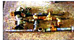
解体前 鉄付バルブ